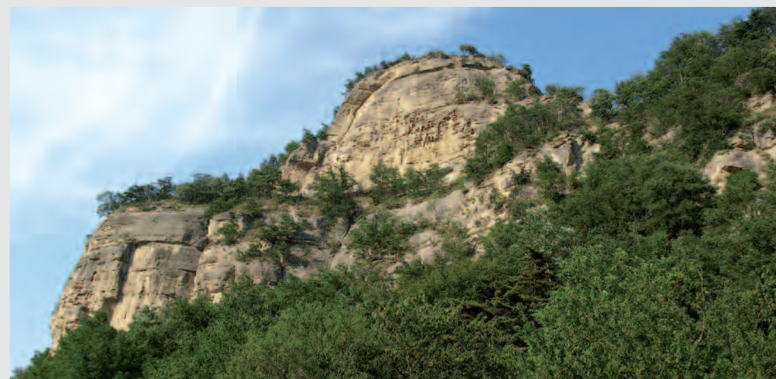
La parete della Rocca di Badolo lungo la valle del Setta.