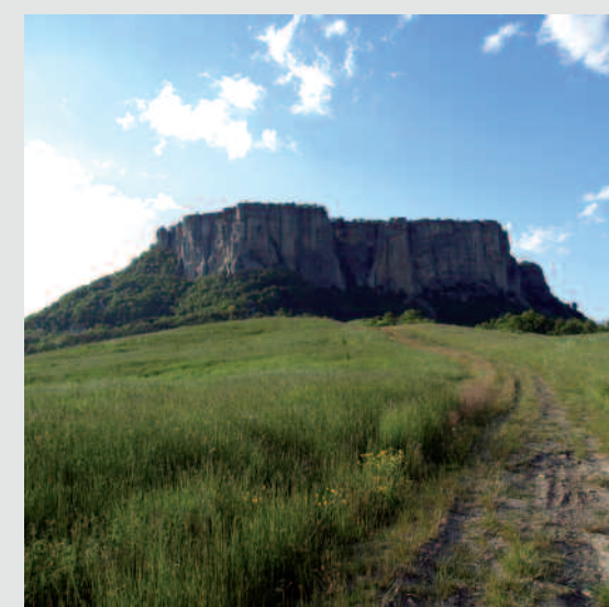
La pietra di Bismantova (Reggio-Emilia)