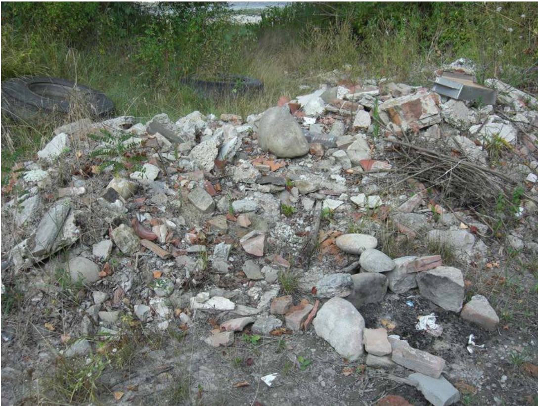
FIGURA 7 – DISCARICA ABUSIVA.

Uno dei problemi ancora irrisolti del sito e fonte di potenziale ulteriore inquinamento di falda e suolo è la presenza di alcune microdiscariche abusive, nonché la presenza di diffuse baraccopoli in sinistra idraulica del Reno (Figura 7). Queste ultime interrompono di fatto la continuità del corridoio ecologico fluviale, frammentando gli habitat 91E0* e 92A0 in piccole tessere non più connesse tra loro.