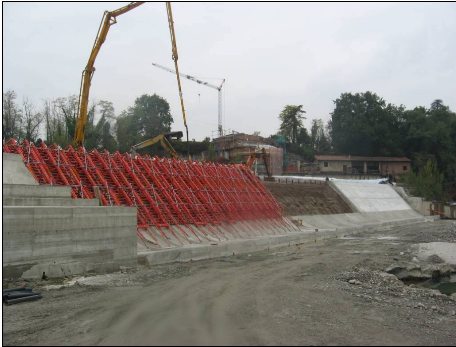
FIGURA 6 – DETTAGLIO DELLA TRAVERSA IN COSTRUZIONE SUL FIUME RENO A PONTECCHIO MARCONI)

Tali sbarramenti sono stati osservati lungo il corso del Fiume Reno, e a tal proposito è stata rilevata la presenza di nuova opera in costruzione (ammodernamento di una traversa fluviale) che potrebbe avere incidenza particolarmente negativa sulla conservazione di molte specie ittiche presenti nel fiume Reno in quanto, ad una prima analisi, è sembrata priva di adeguato passaggio pesci. Si tratta della traversa localizzata a Pontecchio Marconi, all'incirca all'altezza del ponte sul Reno di via Chiù. Un'opera di tali dimensioni e caratteristiche, se non dotata di adeguato passaggio per pesci, rappresenta un elemento di forte disturbo e minaccia per la conservazione di molte delle specie reofile presenti nel corso d'acqua. Anche per quanto riguarda gli altri sbarramenti è stata osservata la mancanza di opportune scale di rimonta per il passaggio dei pesci.