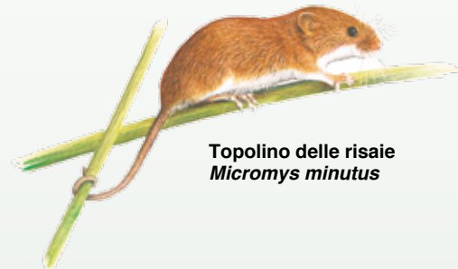
Topolino delle risaie Micromys minutus