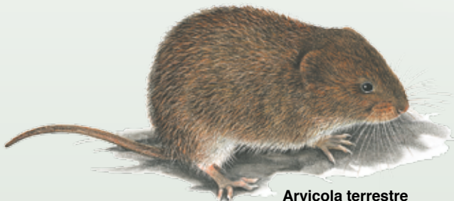
Arvicola terrestre Arvicola terrestris