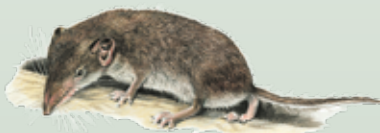
Crocidura minore o Crocidura odorosa Crocidura suaveolens