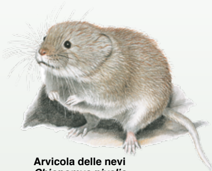
Arvicola delle nevi Chionomys nivalis