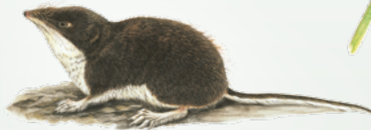
Toporagno d'acqua Neomys fodiens