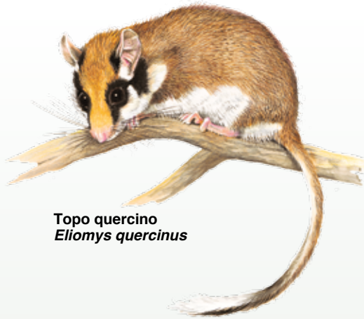
Topo quercino Eliomys quercinus