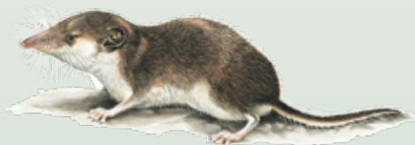
Crocidura a ventre bianco Crocidura leucodon