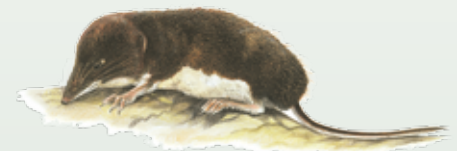
Toporagno acquatico di Miller Neomys anomalus