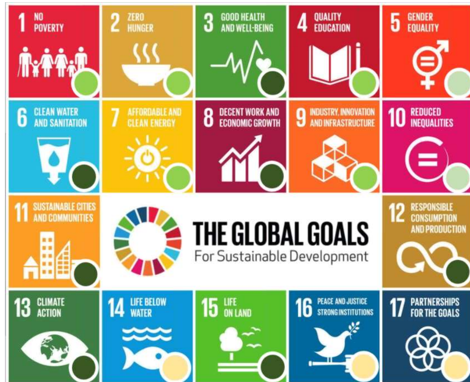
Figura 5. Relazioni tra le Infrastrutture verdi urbane e periurbane e i Goal e Target dell'Agenda ONU 2030