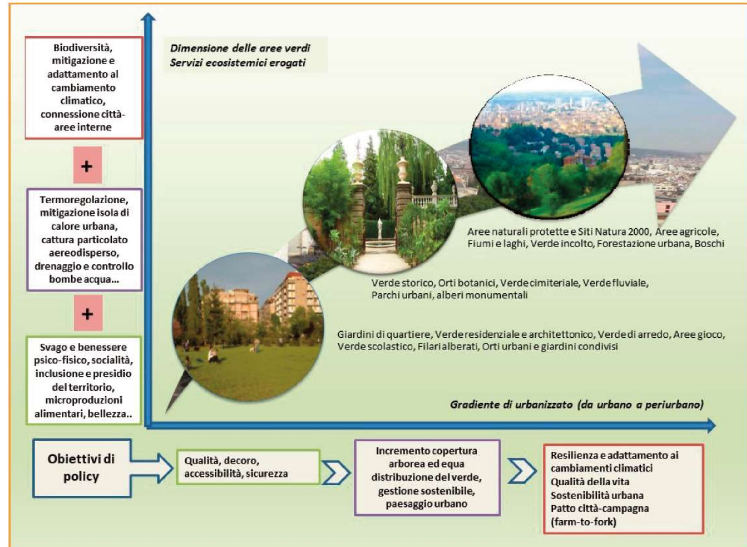
Figura 2. I servizi ecosistemici delle infrastrutture verdi e blu (da Chiesura, 2018)

L'obiettivo generale del bando è di migliorare la qualità del sistema ambientale e microclimatico , delle zone urbane e periurbane, provvedendo a pianificare e realizzare connessioni verdi e blu in grado di infrastrutturare in modo sostenibile il territorio urbano e periurbano , aumentando il grado di naturalità, la resilienza del territorio, il miglioramento del paesaggio, la fruibilità degli spazi e il benessere delle persone.