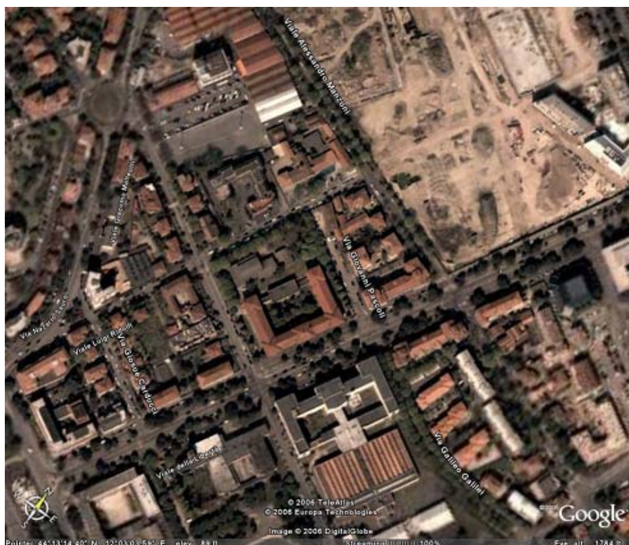
Fig. 1.2: Vista satellitare - Inquadramento generale.

Il complesso scolastico in questione è compreso nel programma delle verifiche tecniche