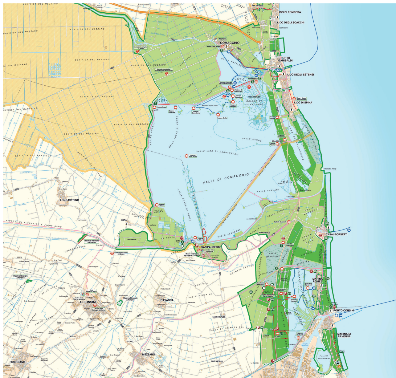
STRALCIO DELLA CARTA DEL PARCO (MAP OF THE PARK). SCALA 1:60.000. EDIZIONE 2023.

Il percorso ciclopedonale Argine degli Angeli si inserisce nel lungo anello, non tutto in sede protetta, che consente di circumnavigare le Valli di Comacchio, partendo e ritornando all'incantevole cittadina lagunare. Il percorso complessivo ha una lunghezza di quasi 60 km; si sviluppa dapprima lungo l'argine di Valle Fattibello, la ciclabile Fosse-Foce e la panoramica S.P. Argine Agosta, a ovest delle Valli di Comacchio, per raggiungere poi la via Rotta che segue fino a Sant'Alberto; da qui raggiunge Volta Scirocco dove si innesta sull' Argine degli Angeli . Dalla Stazione di pesca Bellocchio il percorso prosegue verso Lido di Spina e poi fino a Lido degli Estensi dove si collega alla ciclabile Porto Garibaldi-Comacchio per fare ritorno al punto di partenza.