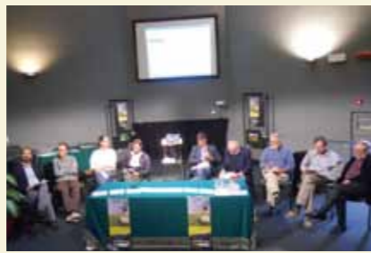
ARCHIVIO RUPE DI CAMPOTRERA