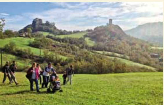
ARCHIVIO RUPE DI CAMPOTRERA

Nel dicembre 2011 l'assemblea legislativa della Regione Emilia-Romagna, con delibera n. 67, ha modificato il provvedimento istitutivo della Riserva Naturale Rupe di Campotrera, ampliandone il perimetro per motivi di ordine conservazionistico e gestionale. L'ampliamento ha consentito di includere per intero nella riserva il geosito che si estende a ridosso della torre medievale della Guardiola di Rossenella (trasformata in centro museale e di accoglienza dal Comune di Canossa), caratterizzato da basalti a pillow di notevole importanza naturalistica e interesse petrografico, mineralogico, geo-