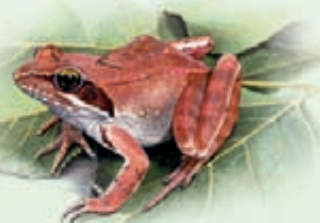
Rana di Lataste Rana latastei