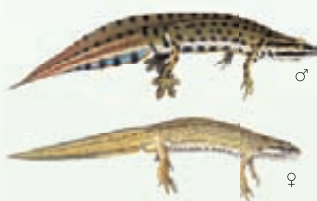
Tritone punteggiato Lissotriton vulgaris