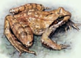
Rana appenninica Rana italica