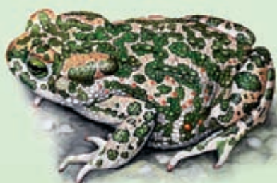
Rospo smeraldino Bufo lineatus