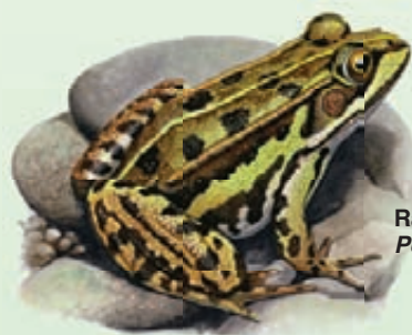
Rana esculenta Pelophylax klepton esculentus