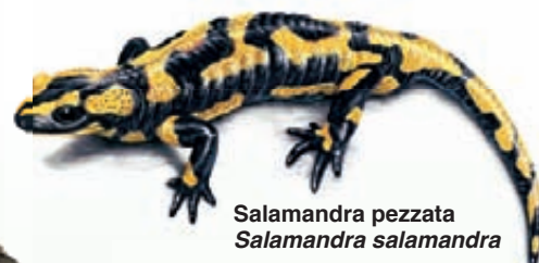
Salamandra pezzata Salamandra salamandra