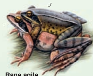
Rana agile Rana dalmatina