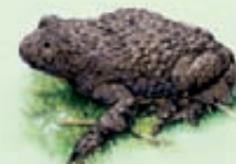
Ululone dal ventre giallo appenninico Bombina pachypus