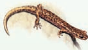
Geotritone di Strinati Speleomantes strinati