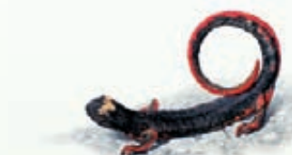
Salamandrina di Savi Salamandrina perspicillata