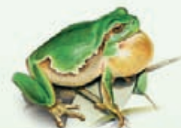
Raganella italiana Hyla intermedia