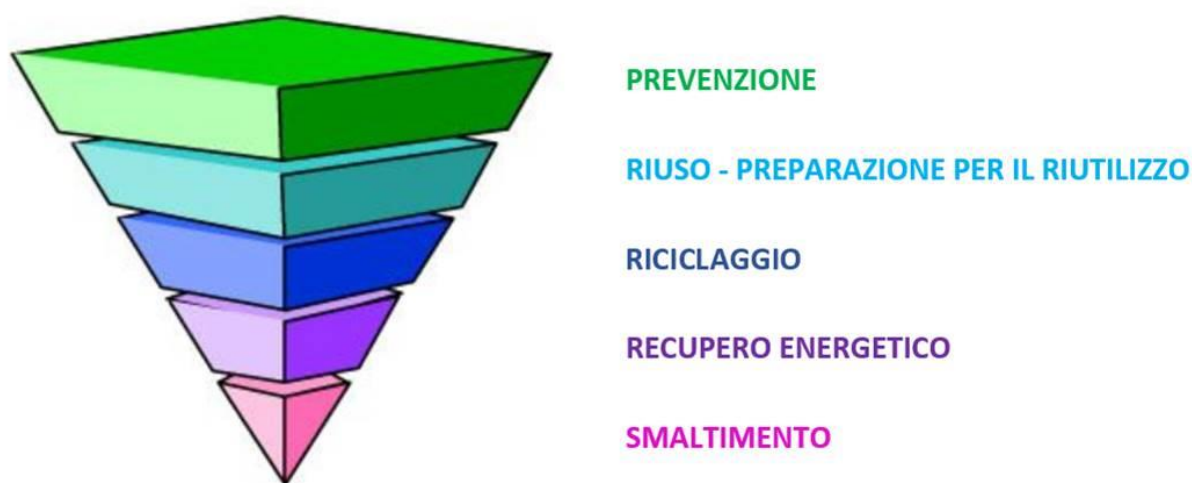
Figura 1: Gerarchia comunitaria di gestione dei rifiuti

In relazione alla produzione totale dei rifiuti urbani si registra nel 2019 un leggero calo rispetto alla base-line di Piano, ma si è ancora distanti dal raggiungimento degli obiettivi previsti al 2020. Questa evidenza, anche in relazione alla grande fluttuazione delle variabili economiche per effetto dell'emergenza COVID-19, necessita di riflessioni approfondite rispetto alla valutazione dei nuovi obiettivi di prevenzione.