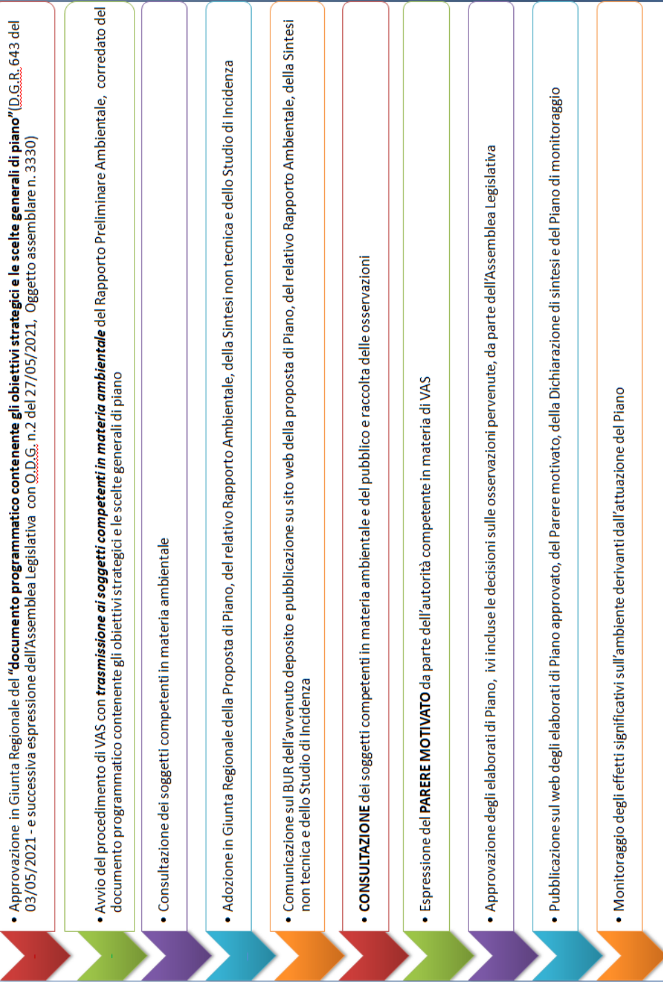
Figura 3-1>Schema del processo di pianificazione e di valutazione del PRRB