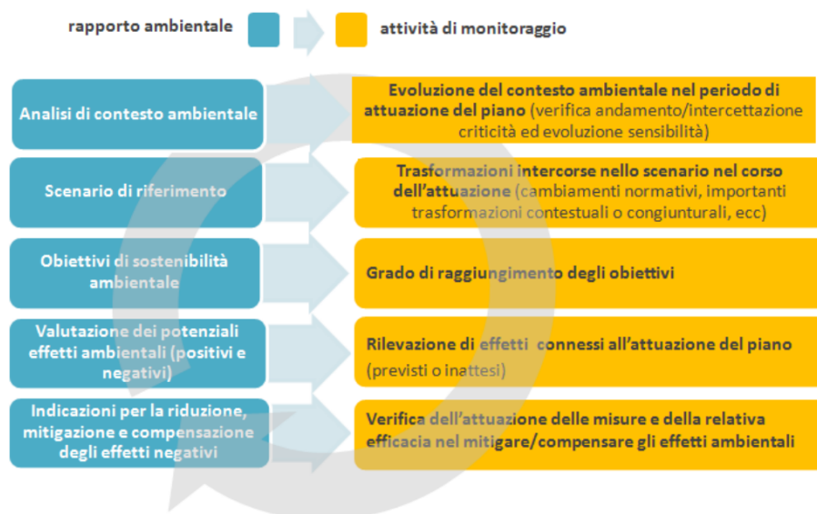
Figura 12-1> Legame tra contenuti del RA e il sistema di monitoraggio nella VAS 3

Gli indicatori rappresentano uno dei principali strumenti per il monitoraggio; essi hanno lo scopo di rappresentare in modo quali/quantitativo e sintetico i fenomeni ambientali, rendendoli comunicabili e permettendo la comparazione fra diverse realtà, ambiti, situazioni.