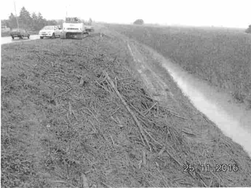
Lavori in corso