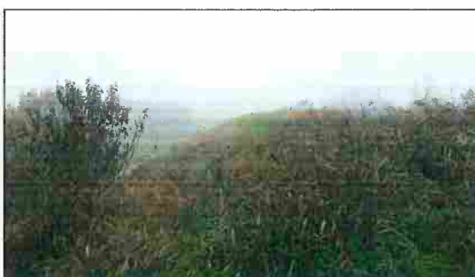
Situazione corpi arginali nei tratti oggetto dei lavori