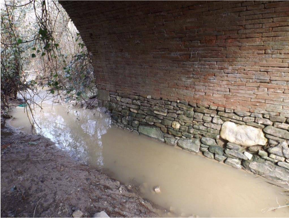
PARTICOLARE PIEDRITTI ARCATA