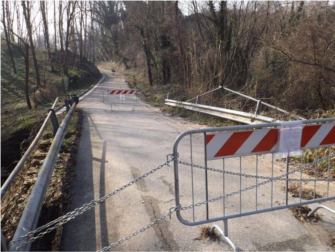
PONTE CHIUSO AL TRANSITO