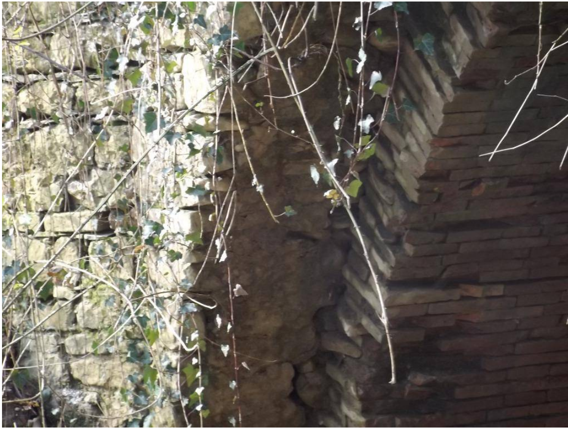
PORZIONE DI ARCATA CROLLATA