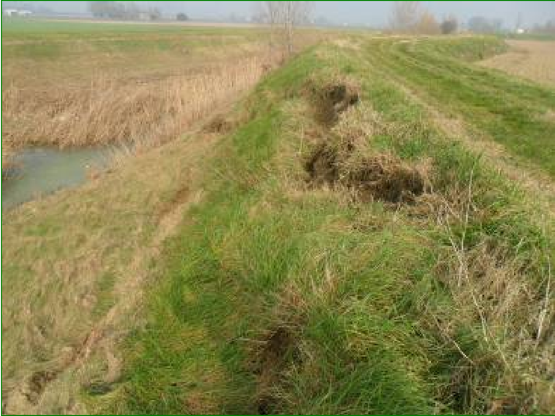
Particolari: Scarpate fluviale franata dall'erosione delle piene