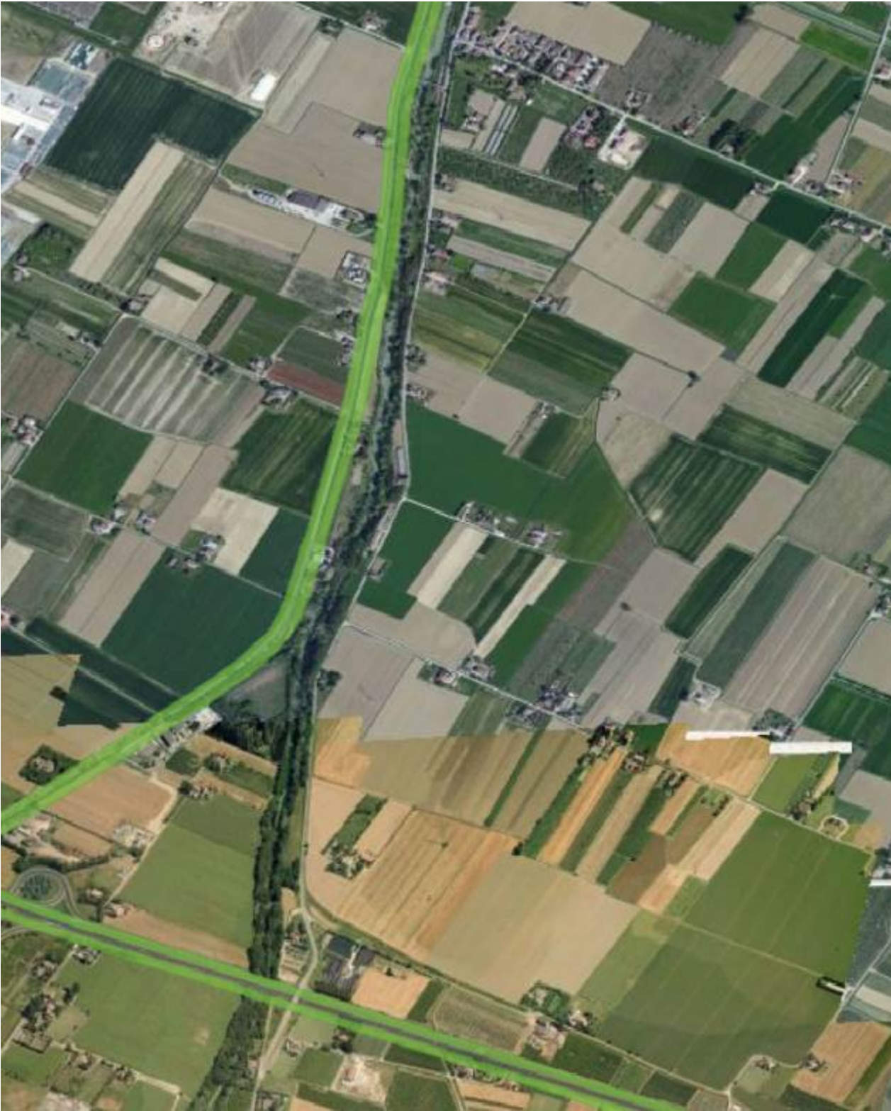
Panoramica: Fiume Ronco da Borgo Sisa al ponte sull'autostrada A 14