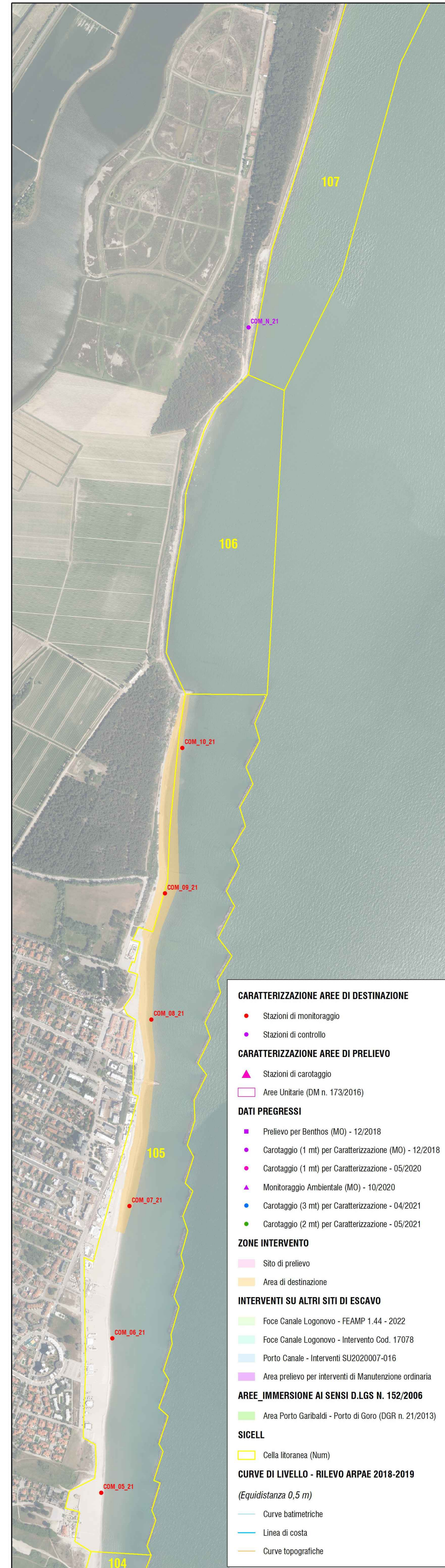
Area di destinazione - Lido delle Nazioni