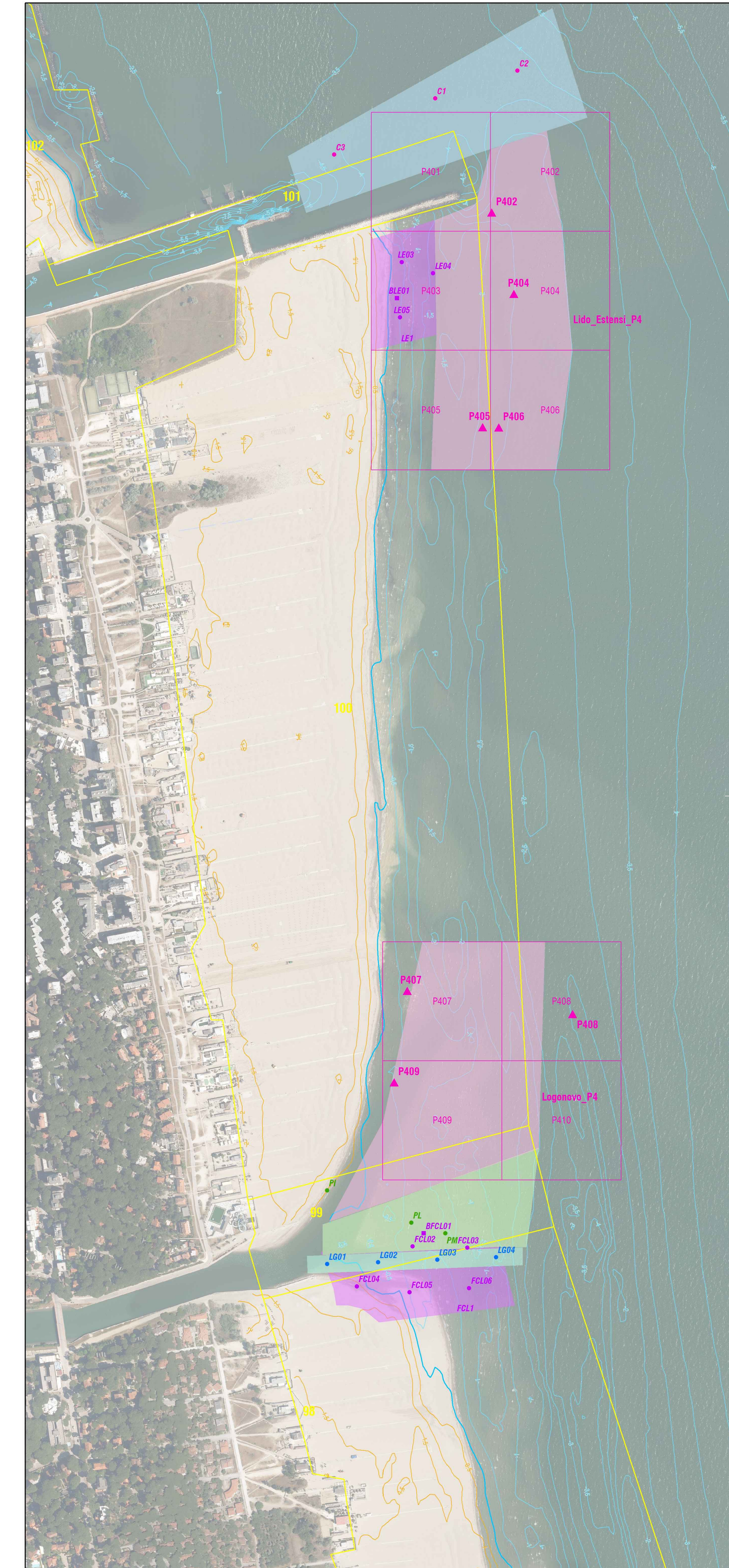
Area di escavo - Lido degli Estensi