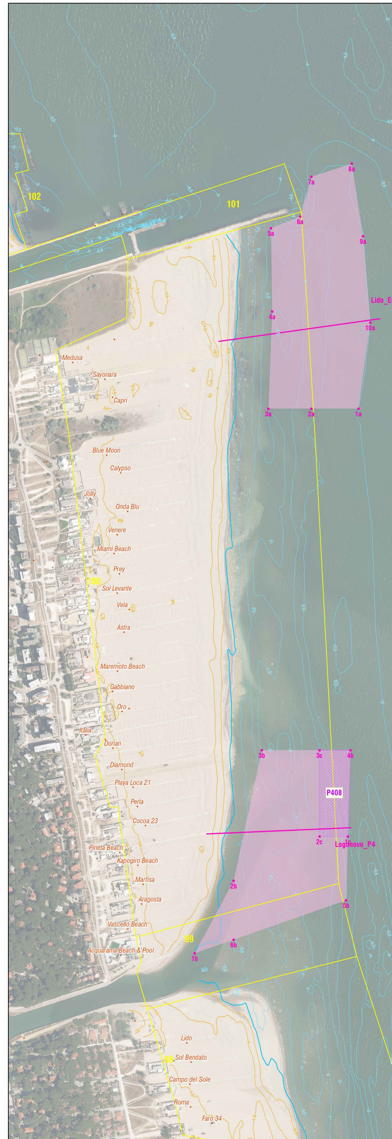
Aree di escavo - Lido degli Estensi - Rappresentazione rilievo Arpae 2018-2019 su ortofoto ARPA ZUO Scala 1:5.000